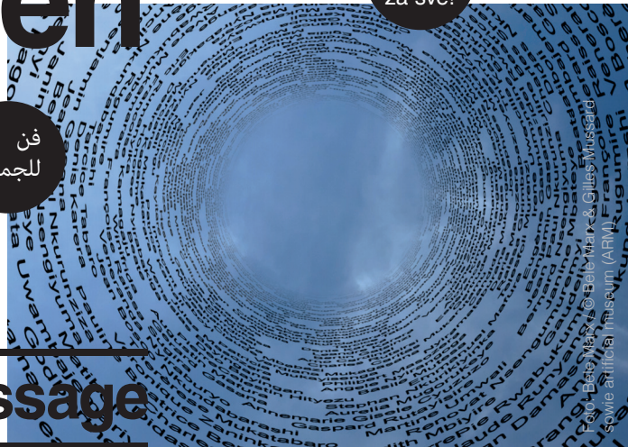
Foto: Betsy Marks © Beate Mark & Gilles Mussard sowie artAfrica Museum (AFM)