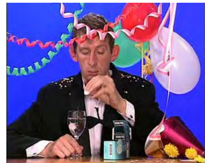
30 m lange Videoinstallation mit 90 Fernsehgeräten